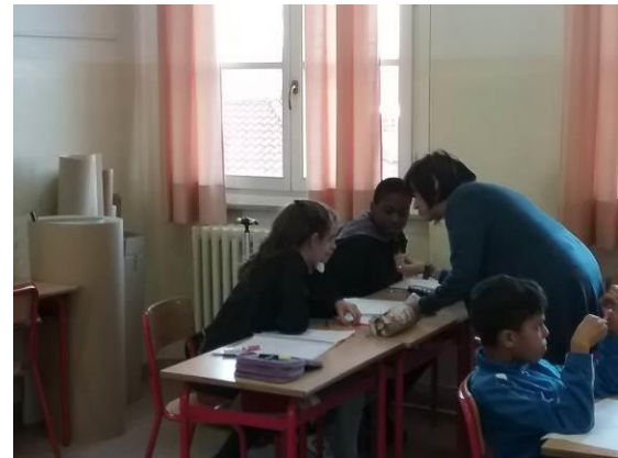
La prof aiuta gli alunni