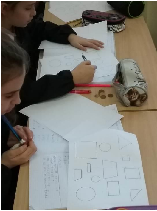
Lezioni di geometria