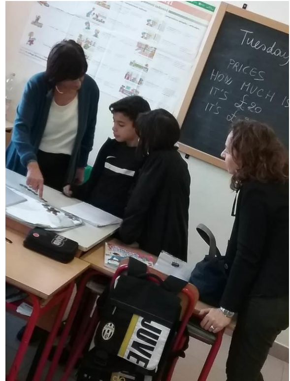
Spiegazioni sulle monete inglesi