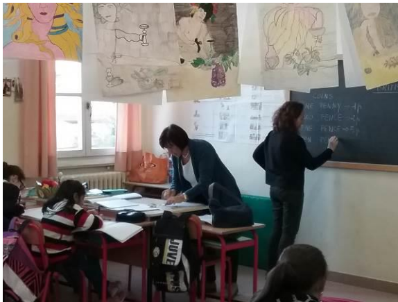
Momenti della lezione